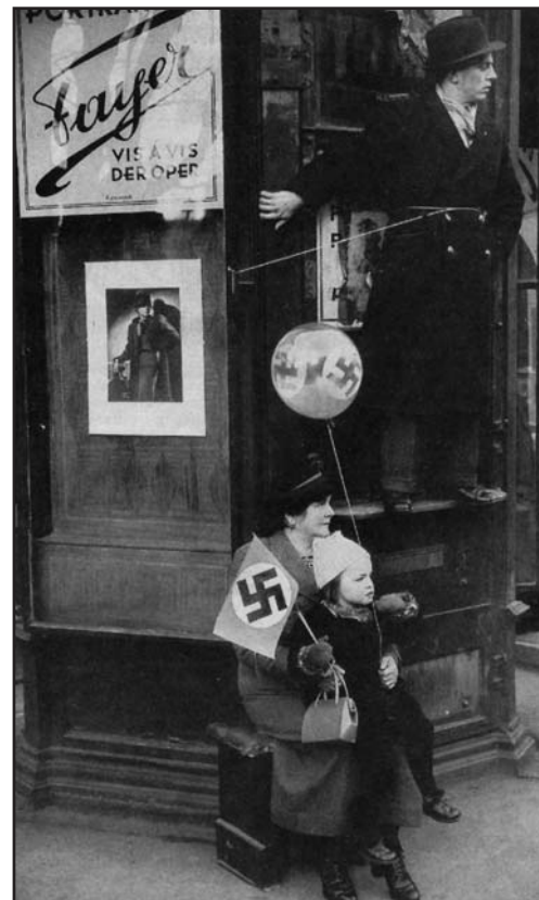
Una foto emblematica del 1938 del celebre fotogiornalista John Phillips: l'arrivo delle truppe tedesche a Vienna. Cosa pensava questa donna seduta con la sua bambina? Era consapevole della folle tragedia che si stava svolgendo?

gli attuali nemici della democrazia e i fanatismi di popolo sui quali essi poggiano il loro consenso.