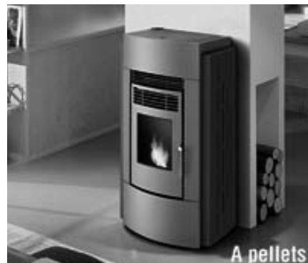
Letizia (kw 12.1) € 1590,00*