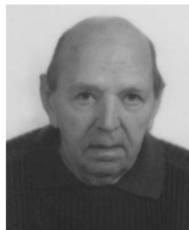
Luigi Treccani 5° Anniversario