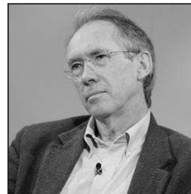
Lo scrittore inglese Ian McEwan.

McEwan, che ora ha 60 anni, è un autore di collaudata esperienza e consolidato successo; la sua prima pubblicazione risale al 1975, e da allora lo scrittore ha