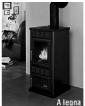
Diana € 390,00*