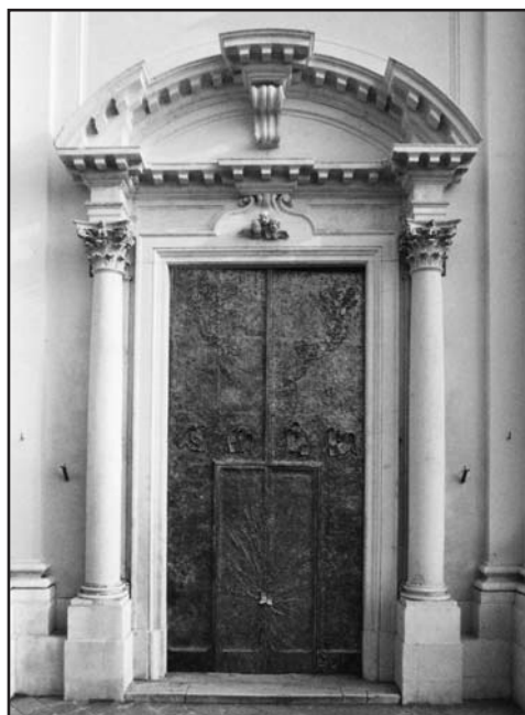
Il portale realizzato dallo scultore Dino Coffani .

Dice don G. Fusari critico d'arte "...il non facile compito dell'artista è stato quello di far rivivere il linguaggio della tradizione con quello più prettamente contemporaneo, incline alla abbreviazione, all'astrazione e alla resa non pienamente realistica delle forme, infatti il portale vive