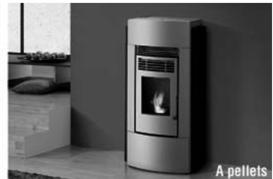
Caterina (kw 9.3) € 1390,00*

*IVA esclusa - Approfittane fino al 31/10/2008