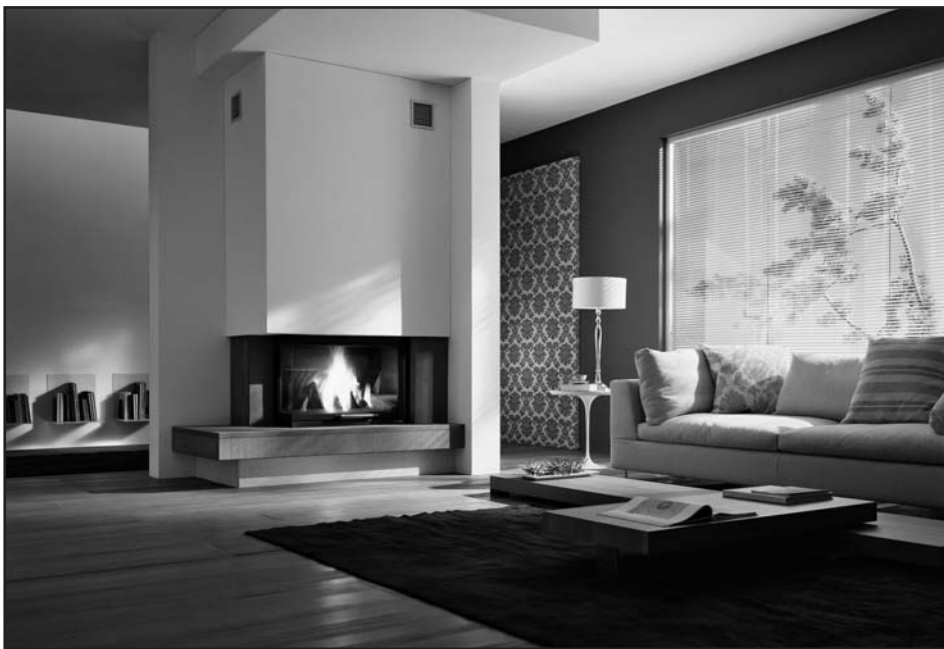
AURONZO € 2390,00*