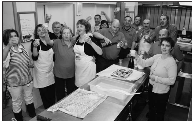
Il brindisi per festeggiare i neonati.