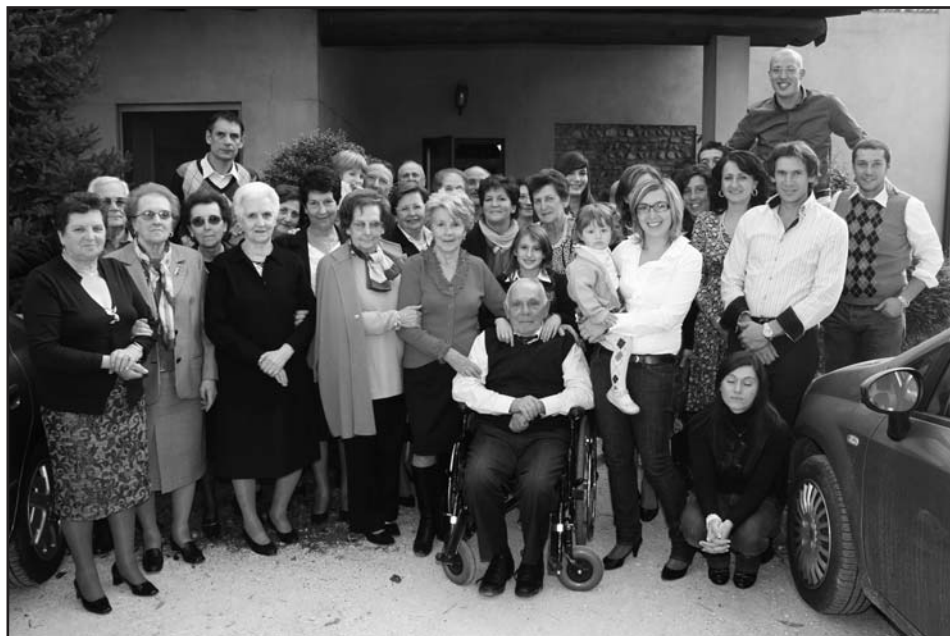
La coppia di sposi festeggiata dai parenti.