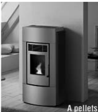
Silvia (kw 6.2) € 1090,00*