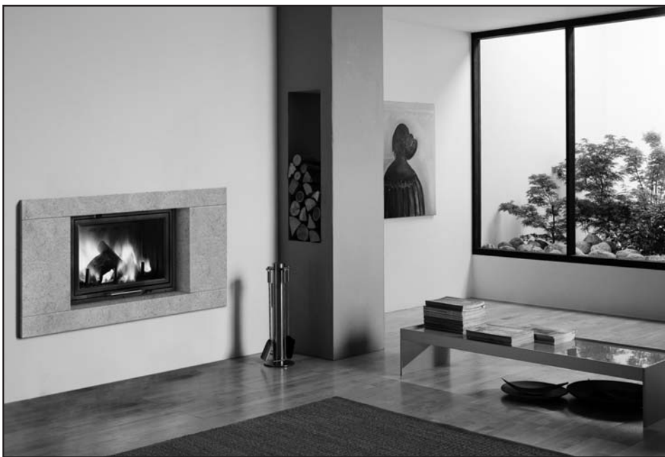
PRAGA € 1990,00*