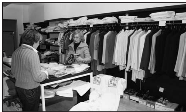
Il buon inizio dell'iniziativa.

Con il ricavato della vendita saremo in grado di aiutare le persone in difficoltà specialmente sotto il versante dei beni di prima necessità come gli alimenta-