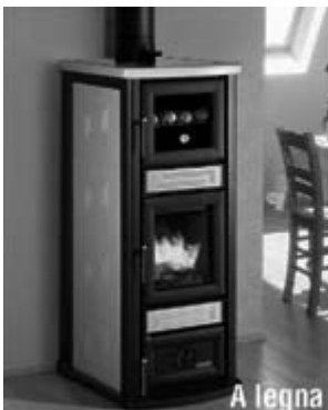
Stella c/forno € 1090,00*