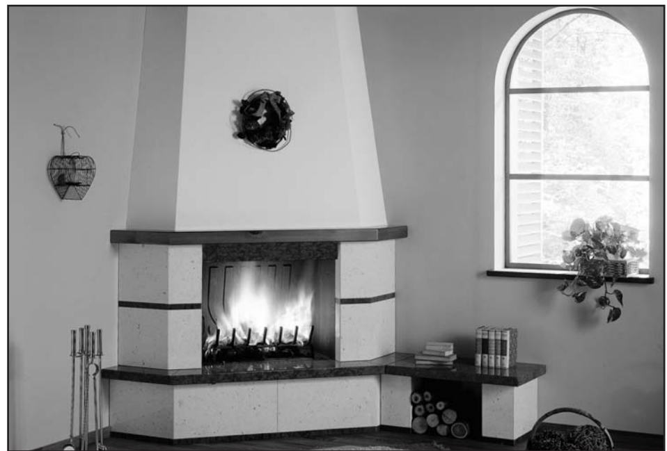
ANVERSA ANGOLO € 2190,00*