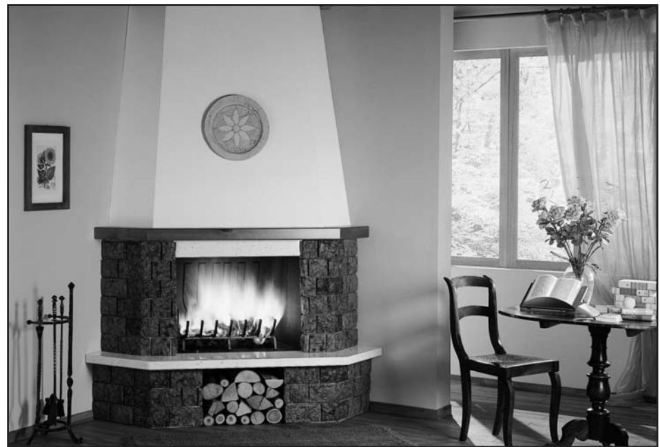
ZARA € 2190,00*